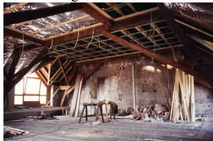
Seminarraum beim Ausbau

Typisch für die Anfangszeit im Studienhaus war „der Druck zur Improvisation und zu manchem Unfertigen und die Leidenschaft der ersten Generationen“. So studierten die Studenten nicht nur (wie ihr Tutor!), sondern sie halfen auch bei den Renovierungs- und Ausbauarbeiten, sie schaufelten Schutt weg und trugen die neuen Fenster, die eingebaut werden sollten, auf die jeweiligen Stockwerke. Doch die inhaltliche Arbeit ging auch voran: „Es entstand ein gemeinsames Forschen und Arbeiten in Sachen bibeltreuer Theologie, das geprägt war von dem echten Fragen junger Menschen nach tragfähigen Grundlagen für Verkündigung, Unterricht und Seelsorge.“