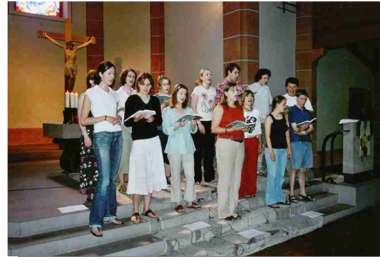
FHSZ-Chor, Gemeindeeinsatz in Ihringen

Im Neuen Testament wird der Begriff „Haus“ als Metapher für die Gemeinde, die Gemeinschaft der Gläubigen verwendet. Daher fungiert das „Haus“, welches aus lebendigen Steinen auf-