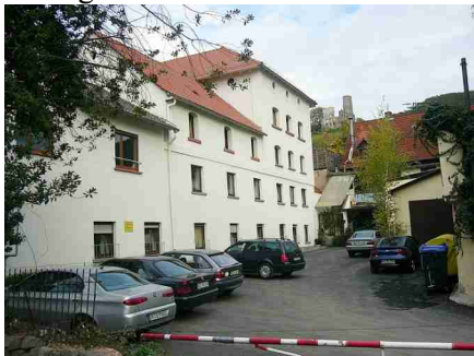
FHSZ – vom „Deutschen Hof“ aus gesehen