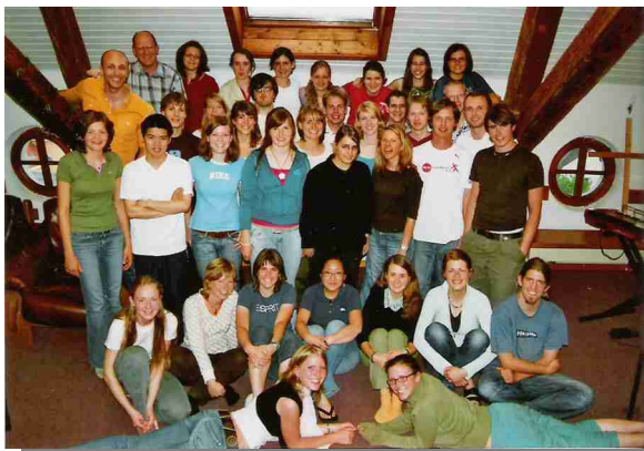
FHSZ-Bewohner, Sommersemester 2007

Wichtig ist mir dabei vor allem, dass auch die Relevanz des Inhaltes der biblischen Texte für unser persönliches Leben als Christen in dieser Welt hervorgehoben wird. Beim Reden über den biblischen Text mag es durchaus auch zu Meinungsverschiedenheiten kommen, die dem einzelnen jedoch bewusst machen, dass niemand von uns „die Weisheit mit Löffeln gefressen hat“.