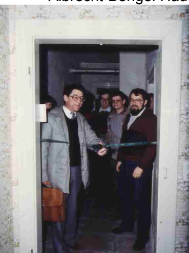
Bild von der Einweihung des Seminarraumes im FHSZ