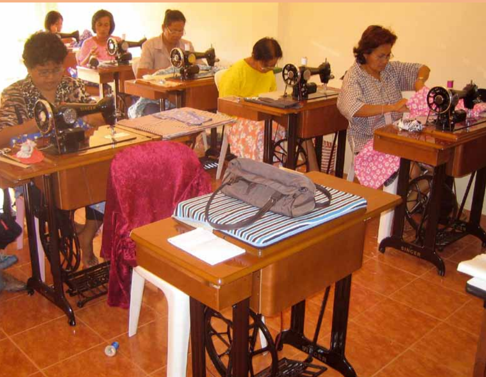
Einheimische Christen bieten einen Nähkurs an, nicht nur für Frauen, die ihre Arbeit verloren haben. Die Frauen, die nicht gläubig sind, kommen Sonntags auch in den Gottesdienst und singen mit.

ditionellen Gegenstände, damit sie ihre Schätze nicht hergeben für Glasperlen und Alkohol. Sie geben der Bevölkerung Selbstbewusstsein und Würde. Es gibt zahllose Beispiele, in denen die heilende Kraft des Evangeliums eindrucksvoll sichtbar geworden ist: