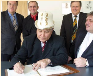
Zusammenleben in Kirgisien entscheidende Impulse. Das Missionswerk räume der Kenntnis anderer Kulturen hohe Priorität ein. -mk-

Auf dem internationalen Bibelserver ( www.bibleserver.com ) werden jetzt Übersetzungen in 20 europäischen Sprachen angeboten, darunter sechs deutsche Versionen. Der Server wird monatlich etwa 140.000 Mal angeklickt. -mk-